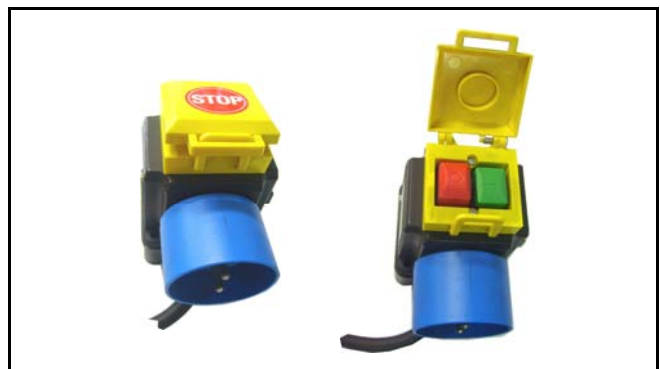
Interruttore di sicurezza/safety switch Bobina di minima tensione/min. voltage Freno motore/motor brake CODICE/CODE: 2255 V 230 - 16 A