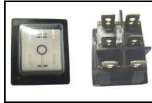
Invertitore rotazione reverse switch I - II CODICE/CODE: 1968 V 230 - 10 A