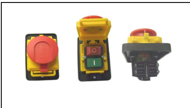
Interruttore di sicurezza/safety switch Bobina di minima tensione/min. voltage coil Arresto di emergenza/emergency stop CODICE/CODE: 2399 V 230 - 10 A