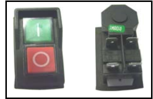
Interruttore di sicurezza safety switch Bobina minima tensione/ min voltage coil CODICE/CODE: 1992 V 230 - 16 A