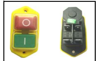
Interruttore di sicurezza safety switch Bobina minima tensione min. voltage coil CODICE/CODE: 2209 V 110 - 16 A