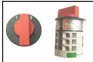
Invertitore rotativo rotating reverse switch CODICE/CODE: 2319 V 230 - 16 A