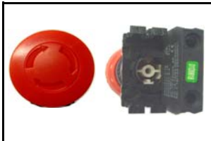
Pulsante di emergenza emergency button CODICE/CODE: 2199 V 230 - 12 A