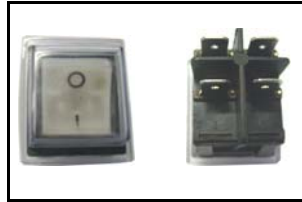
Interruttore/switch 0 - I CODICE/CODE: 1941 V 230 - 10 A