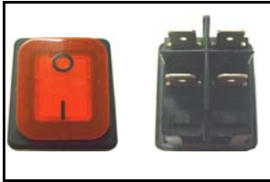
Interruttore/switch 0 - I Luminoso/Lighted CODICE/CODE: 1967 V 230 - 12 A